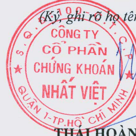
THAI HOÀNG LONG