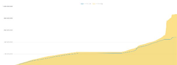
Chỉ số phái sinh