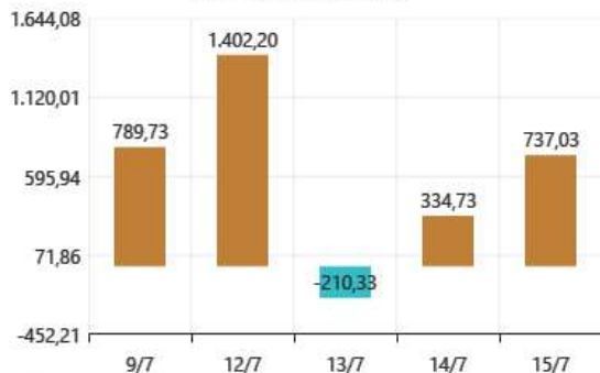
Giao dịch NĐTNN - Ngày