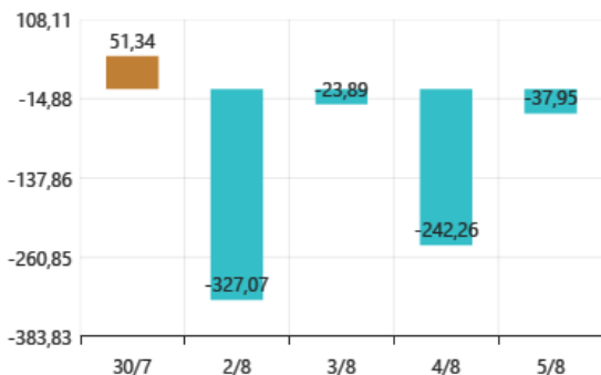
Giao dịch tự doanh ròng - Ngày