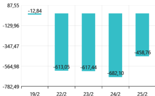
Giao dịch NĐTNN - Ngày