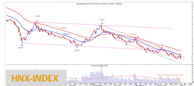
Biểu đồ HN-Index daily

Các chỉ báo trung hạn trong hệ thống của chúng tôi cho tín hiệu xu hướng vẫn đang giảm. Chỉ số cố gắng quay lại bên trong mô hình cái niêm hướng xuống với dấu hiệu chưa rõ nét. Ngày giao dịch và chờ diễn biến mới.