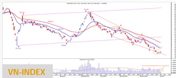
Biểu đồ VN-Index daily