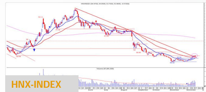
Biểu đồ HNX-Index daily

Các chỉ báo trung hạn trong hệ thống của chúng tôi cho tín hiệu xu hướng vẫn đang tăng. Chỉ số vẫn trên MA 20 kỳ và MA 50 kỳ cho thấy khả năng xu hướng tăng còn tiếp tục. Nhà đầu tư trung hạn nên giữ cổ phiếu để đi theo xu hướng tăng.