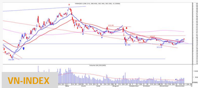
Biểu đồ VN-Index daily