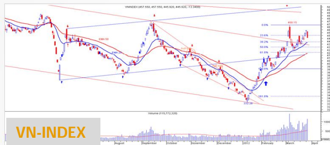
Biểu đồ VN-Index daily