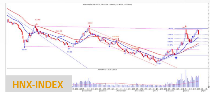
Biểu đồ HN-Index daily

Các chỉ báo trung hạn trong hệ thống của chúng tôi cho tín hiệu xu hướng tăng vẫn còn. Có thể swing bán cao – mua thấp liên tục nhằm giảm giá vốn danh mục.