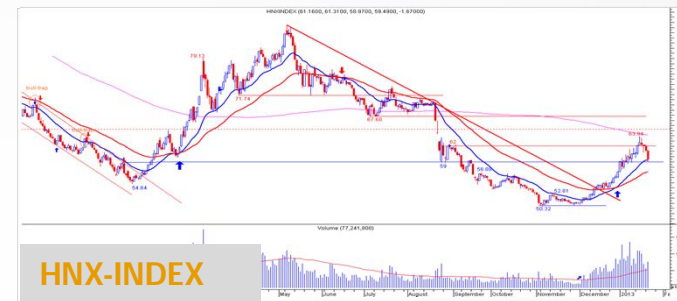
Biểu đồ HNX-Index daily

Các chỉ báo trung hạn trong hệ thống của chúng tôi cho tín hiệu xu hướng vẫn còn tăng. Chỉ số vẫn trên MA 20 kỳ và MA 50 kỳ. Nhà đầu tư trung hạn có thể giữ cổ phiếu để đi theo xu hướng tăng hoặc nếu đã bán ra để cơ cấu thì nên tranh thủ mua vào lại khi chỉ số đang về gần MA 20 kỳ.