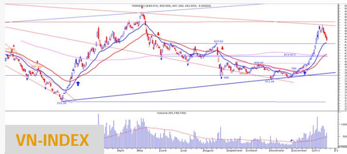
Biểu đồ VN-Index daily