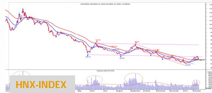
Biểu đồ HNX-Index daily

Các chỉ báo trung hạn trong hệ thống của chúng tôi cho tín hiệu xu hướng tăng tuy nhiên khối lượng của đợt tăng này thấp so với 3 đợt tăng trước đó cho thấy dòng tiền mới chưa có. Chỉ số đang điều chỉnh về vùng hỗ trợ quanh các đường MA. Chờ diễn biến tiếp theo.