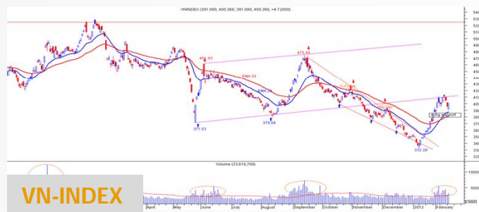
Biểu đồ VN-Index daily