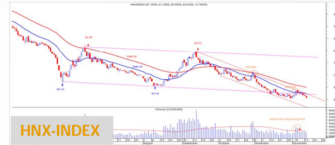
Biểu đồ HNX-Index daily

Các chỉ báo trung hạn trong hệ thống của chúng tôi cho tín hiệu xu hướng giảm, đợt tăng vừa qua xác nhận là một bẫy tăng giá (bull-trap). Giá đang dịch chuyển gần hoàn thành một nêm hướng xuống (falling wedge). Ngừng giao dịch và chờ diễn biến mới.