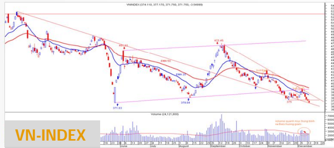
Biểu đồ VN-Index daily